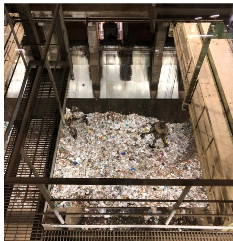
ごみ焼却施設の様子